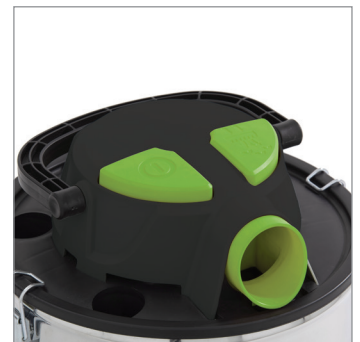
ASA Y RUEDAS FÁCIL TRANSPORTE EASY PUSH SYSTEM HANDLE