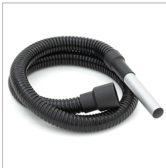
TUBO DE 2 METROS CON EL INTERIOR EN METAL 2MT. FLEXIBLE HOSE WITH METAL INTERIOR